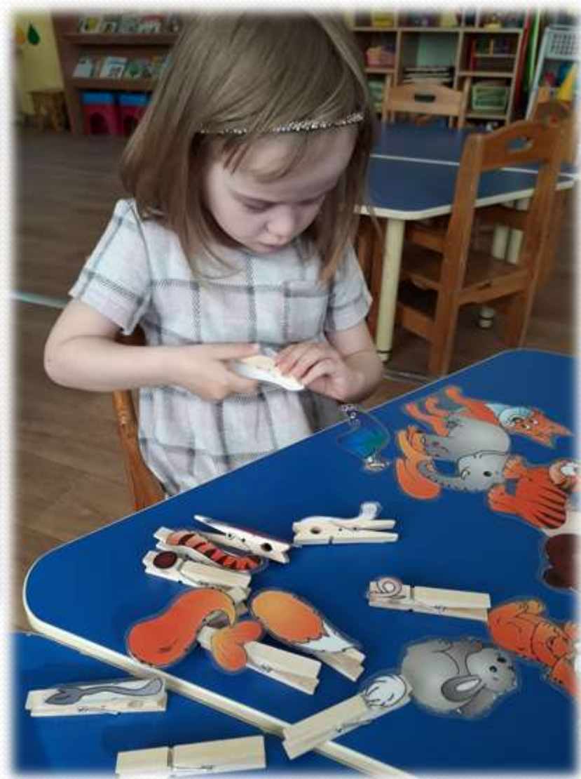
Д/И « Чей хвост »